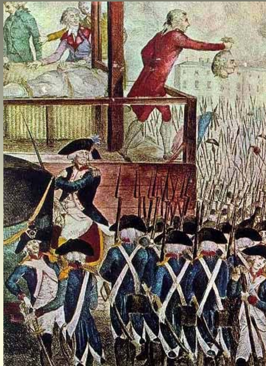
Exécution de Robespierre le 28 juillet 1794