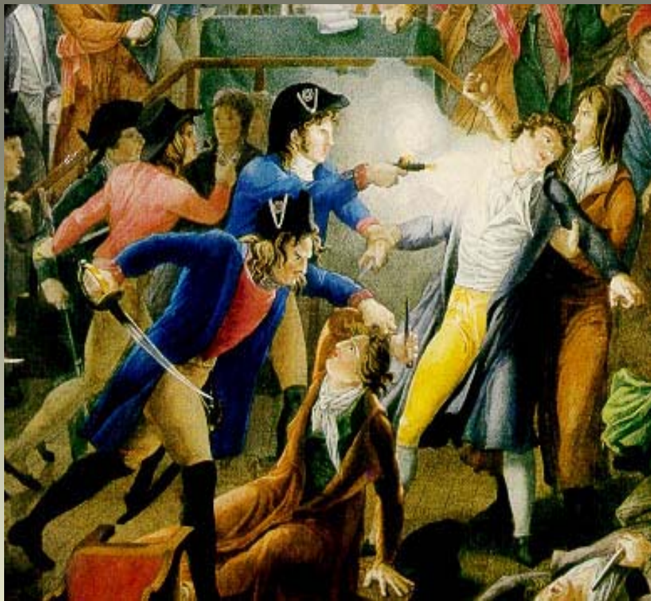
27 juillet 1794, arrestation de Robespierre