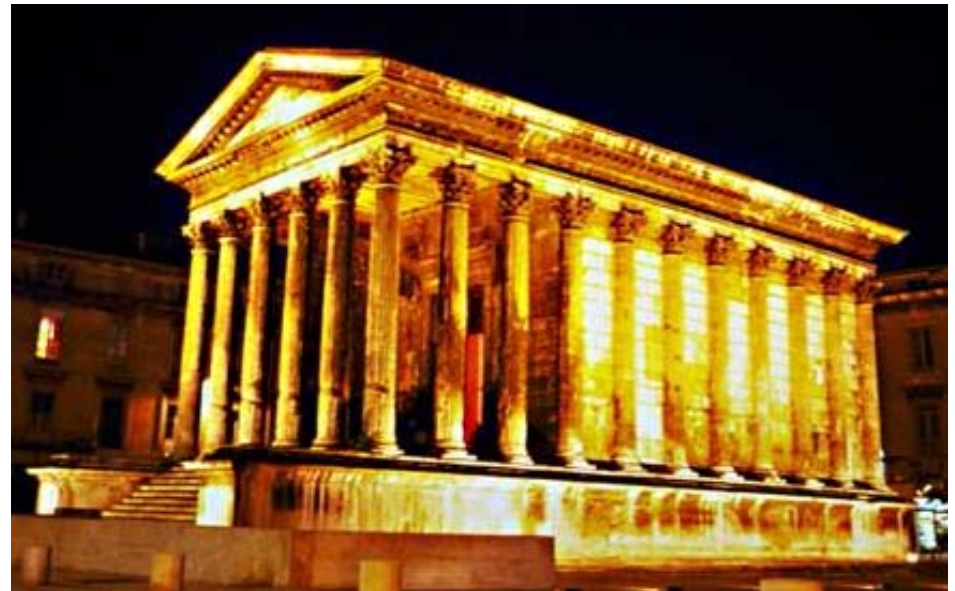
Nîmes, Maison carrée