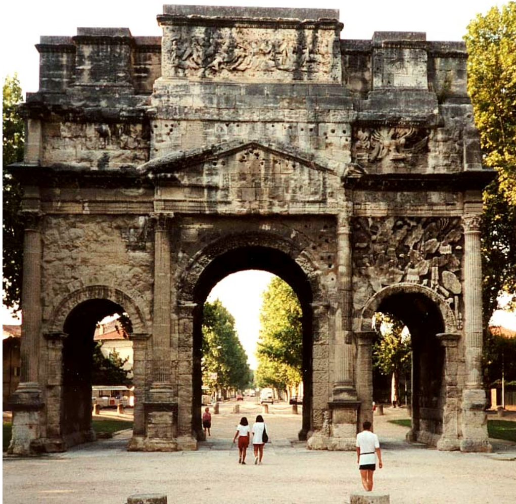
Orange, Arc de triomphe