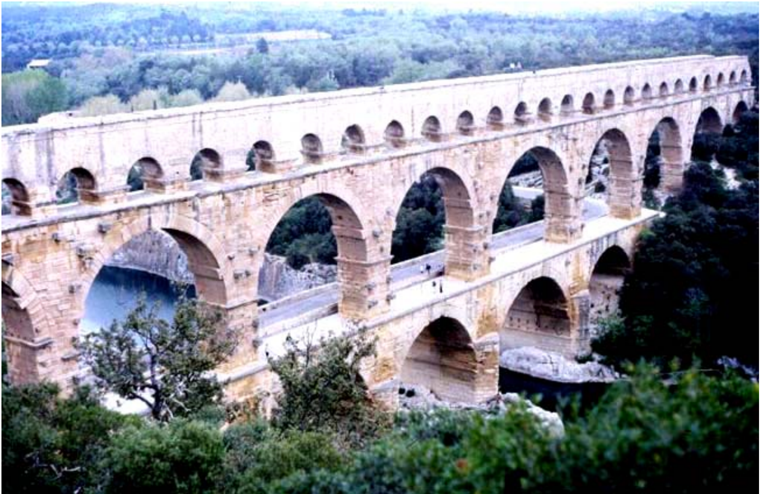
Le Pont du Gard